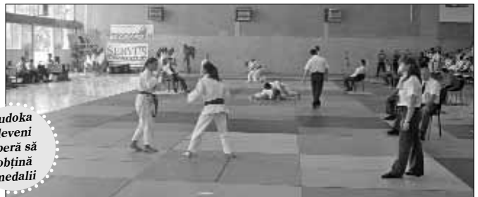
Judoka devenii speră să obțină medalii