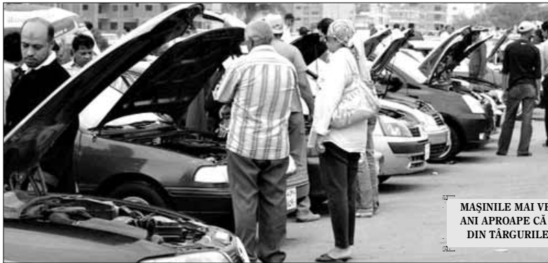
MAȘINILE MAI VECHI DE ZECE ANI APROAPE CĂ AU DISPĂRUT DIN TÂRGURILE JUDEȚULUI

Decizia ministrului Mediului, Laszlo Borbely de a cere o derogare până în 2013 la aplicarea taxei auto în cazul ma-